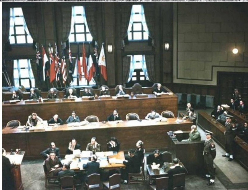
Зал судебных заседаний Нюрнбергского трибунала

Перед Трибуналом предстали 24 военных преступника, входивших в высшее руководство фашистской Германии. Все они были руководителями, подстрекателями и участниками нацистской партии во главе с Адольфом Гитлером, потрясшей мир своей нечеловеческой жестокостью. Впервые перед судом предстали преступники, завладевшие целым государством и сделавшие государство орудием своих чудовищных преступлений.