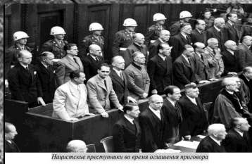
Нацистские преступники во время последнего приговора