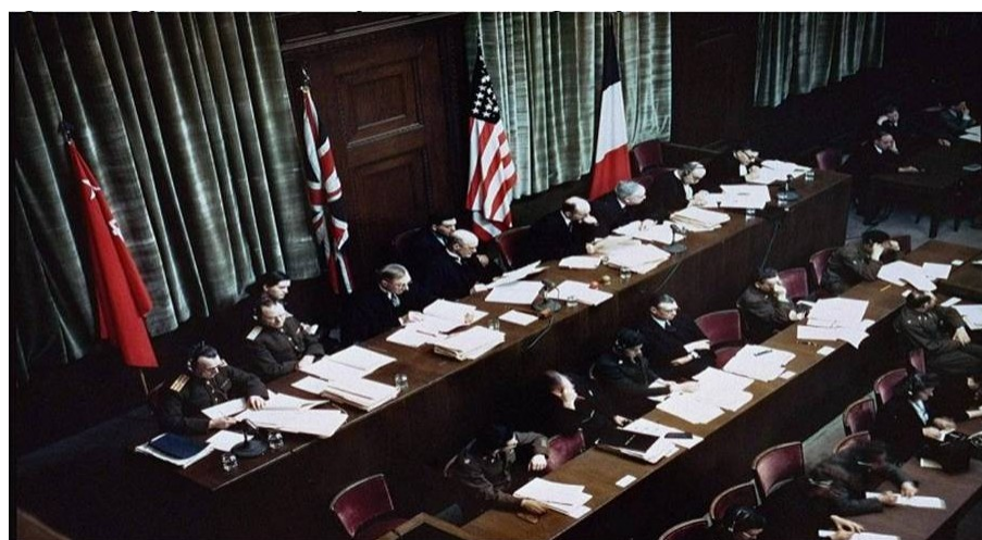
Международная судебная коллегия Нюрнбергского трибунала

Перед Трибуналом предстали 24 военных преступника, входивших в высшее руководство фашистской Германии. Все они были руководителями, подстрекателями и участниками нацистской партии во главе с Адольфом Гитлером, потрясшей мир своей нечеловеческой жестокостью. Впервые перед судом предстали преступники, завладевшие целым государством и сделавшие государство орудием своих чудовищных преступлений.