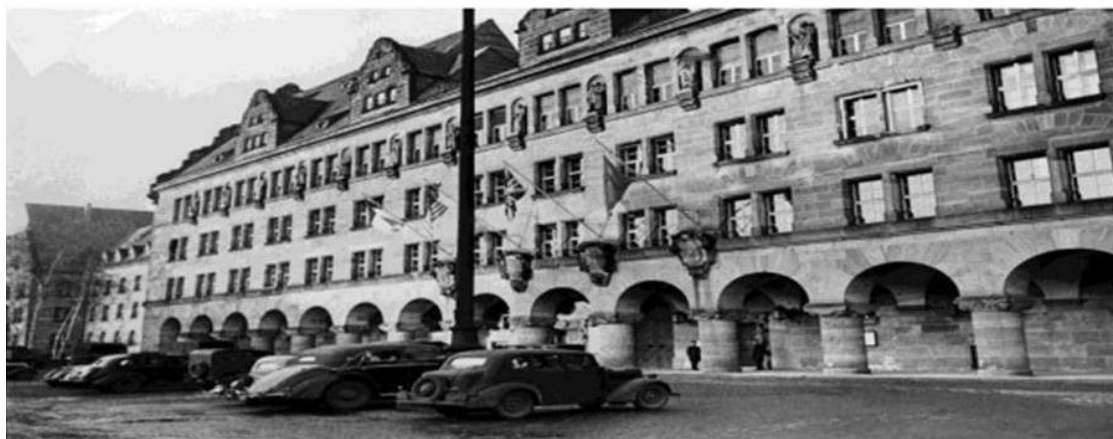
Фасадная сторона Нюрнбергского Дворца правосудия, 1946 г.

Это был НЮРНБЕРГСКИЙ ТРИБУНАЛ, первый в истории международный военный суд, впервые осудивший преступления против человечества. И судили на нем главных немецких военных преступников, развязавших Вторую мировую войну. Войну, которая продолжалась 6 лет и в которой участвовало более 60 государств. Войну, площадь военных действий которой была свыше 22 миллионов километров и в которой участвовало 110 миллионов солдат и офицеров. Войну, унесшую жизни более 50 миллионов человек, а ранившую и искалечившую - 90 миллионов. Войну, оставшуюся в истории нашей страны Великой отечественной войной, унесшей жизни почти 30 миллионов советских людей.