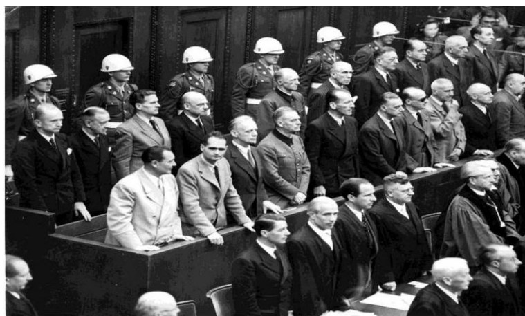
Нацистские преступники во время оглашения приговора

Но никто из подсудимых свою вину в совершении страшных преступлений так и не признал.