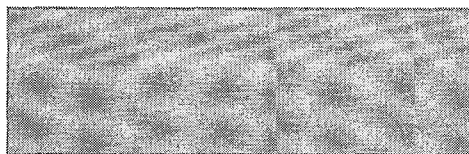
Рисунок 1. Схема подвески

Подвеска автомобиля играет роль соединительного звена между кузовом автомобиля и дорожным покрытием [1, С. 5-15]. В современных автомобилях каждую из функций подвески выполняет отдельный конструктивный элемент [2]. ... Схема разработанной мной подвески представлена на рисунке 1.